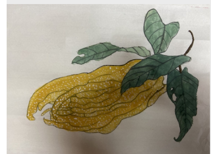
《金佛手》 采购公司商务部部长之女 张逸扬