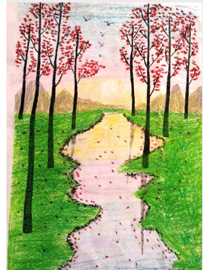
《风景》 商变蒙沃基地 宋婷婷