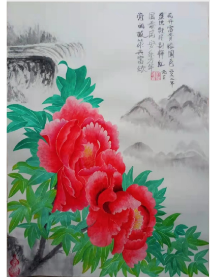
《国色天香》 齿轮二工厂 刘荷涛