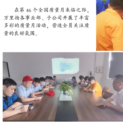
▲质量管理能力提升培训