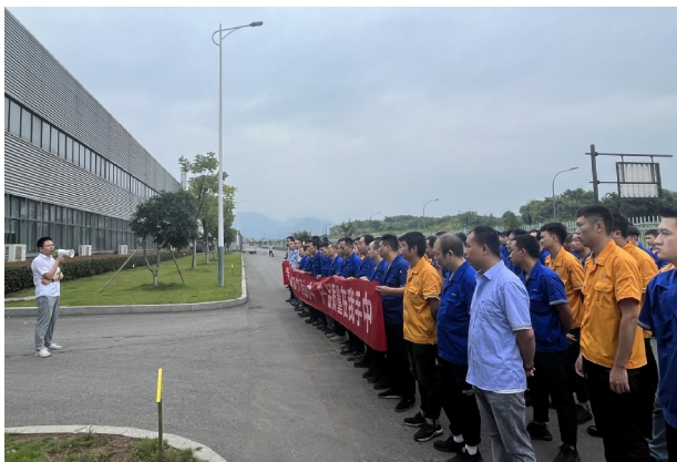
▲质量月活动启动大会