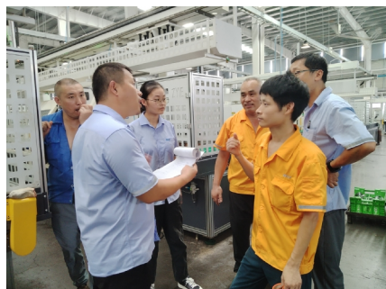
▲内部客户质量走访对接