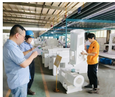
▲检验员技能等级评定

9月15日下午,万里扬 MDM 项目组召开了主数据管理系统最终用户培训宣贯会议,来自股份公司各单位的 114 名 MDM 系统最终用户参加了现场培训与上岗考试。